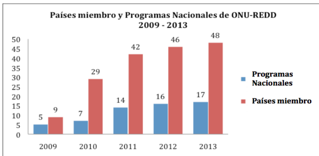
Diagrama 1: Número de países miembro del Programa ONU-REDD y número de países con Programas Nacionales de 2009 a octubre de 2013.

Entre los beneficios indirectos generados por el AAN y los Programas Nacionales, es importante mencionar que muchos países pueden aprovechar el apoyo proveniente de otras fuentes tales como el FCPF, el FIP y la cooperación bilateral. Costa Rica, México y Surinam son ejemplos de países que no han recibido apoyo a través de un Programa Nacional, pero que han aprovechado otros tipos de ayuda y fortalecido sus esfuerzos nacionales de REDD+ a través del AAN (ver diagrama 1).