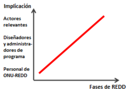
Diagrama 4. Implicación en la herramienta

La herramienta puede ser usada por diversos actores con múltiples objetivos. En la fase inicial, podría ser el personal del Programa ONU-REDD quien la utilice, con el fin de diagnosticar áreas de mayor riesgo e incluirlas en las consideraciones para la priorización del programa en el país. Los diseñadores del Programa podrán utilizarla para determinar en qué áreas pueden mejorar el diseño y así minimizar el riesgo de un impacto social negativo. Los participantes podrán aplicarla para entender mejor sus derechos y oportunidades de participación.