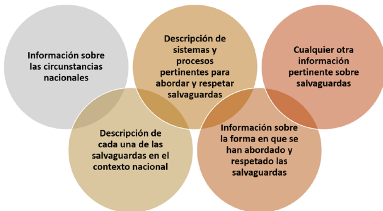
Figura 3: Elementos de la “Orientación adicional para asegurar la transparencia, la coherencia, la exhaustividad y la eficacia al informar sobre la forma en que se están abordando y respetando todas las salvaguardias” (Decisión 17/CP.21).

La COP 21 de París adoptó orientaciones sobre resúmenes de información, resumidas en la Figura 2. En particular se establece que los países deben indicar qué actividad o actividades de REDD+ han incluido en el resumen de la información. Los países también pueden incluir: (1) descripciones sobre cada salvaguarda de acuerdo con las circunstancias nacionales, (2) descripciones de los sistemas y procesos ya existentes, pertinentes para el abordaje y respeto de las salvaguardas (incluyendo el SIS), e (3) información sobre cómo cada una de las salvaguardas ha sido abordada y respetada. La estructura del SIS puede influir de manera importante sobre la estructura del resumen de información. Así como para el SIS, también se establece en la decisión que los países pueden mejorar la información proporcionada en el resumen, teniendo en cuenta un enfoque escalonado.